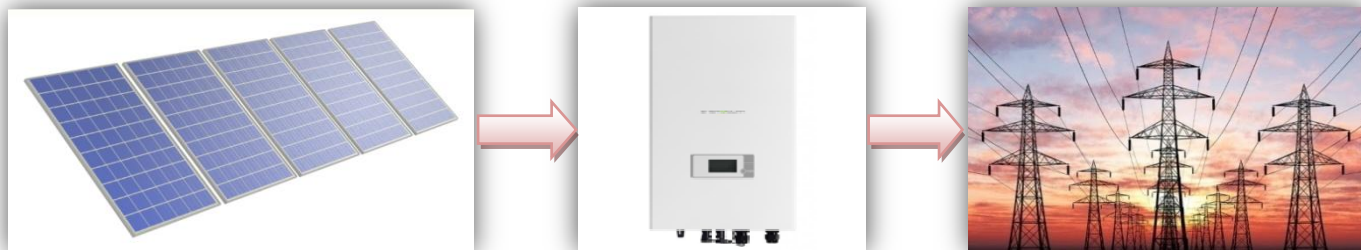
Схема работы сетевой солнечной электростанции

Годовая производительность системы 15,0 кВт – 18110,32 кВт·ч/год* .