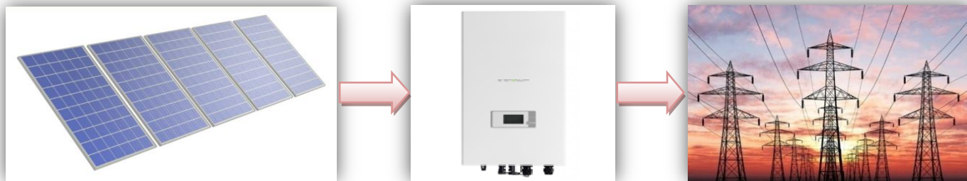
Схема работы сетевой солнечной электростанции

Годовая производительность системы 20,0 кВт – 24147,09 кВт·ч/год* .