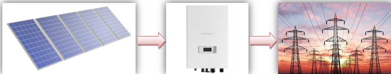
Схема работы сетевой солнечной электростанции

Годовая производительность системы 30,0 кВт – 36220,64 кВт·ч/год* .