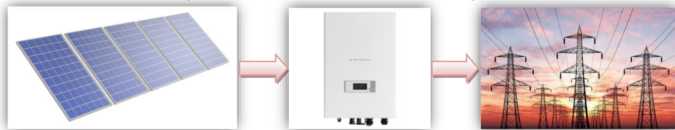
Схема работы сетевой солнечной электростанции

Годовая производительность системы 4,0 кВт – 4829,42 кВт·ч/год* .